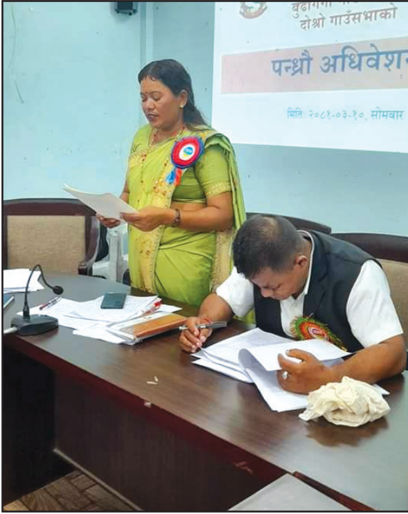
गाउँसभाको पन्ध्रौ अधिवेशनमा बजेट तथा कार्यक्रम प्रस्तुत गर्नु हुँदै उपाध्यक्ष ज्यू