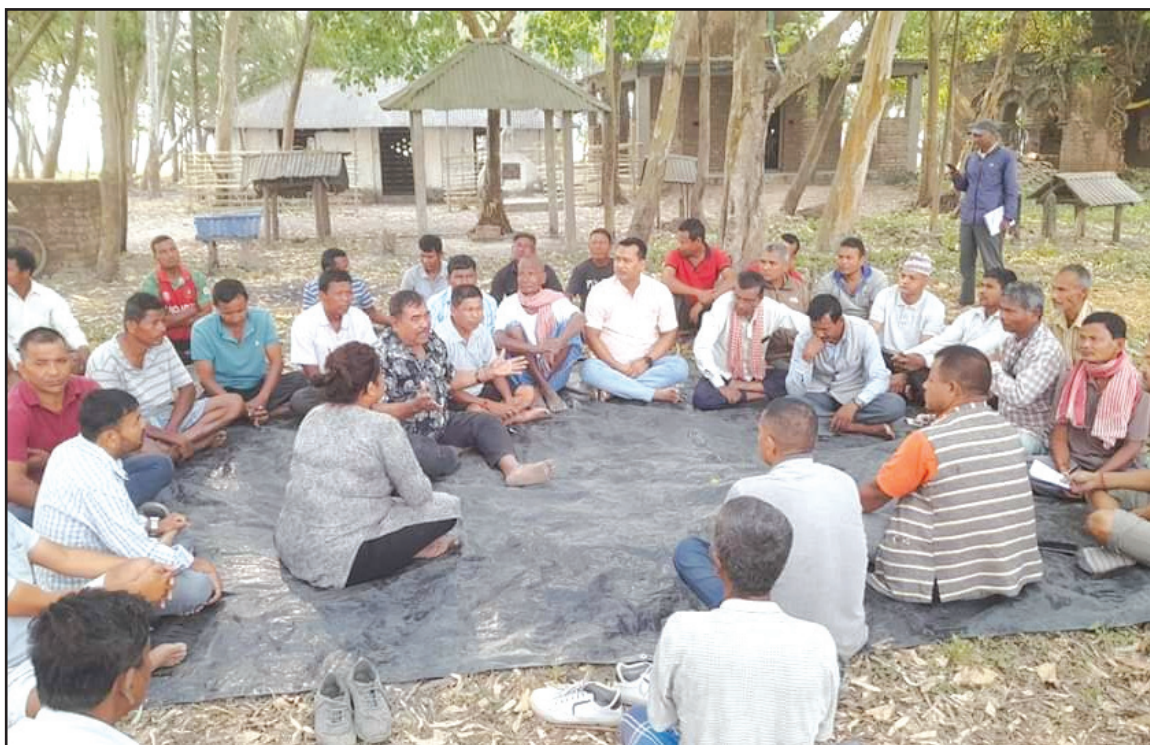
समसामयिक तथा विकास गतिविधि बारेमा जनताको घरदैलोमा पुगेर राय परामर्श तथा सुझाव लिनु हुँदै गा.पा. अध्यक्ष ज्यू