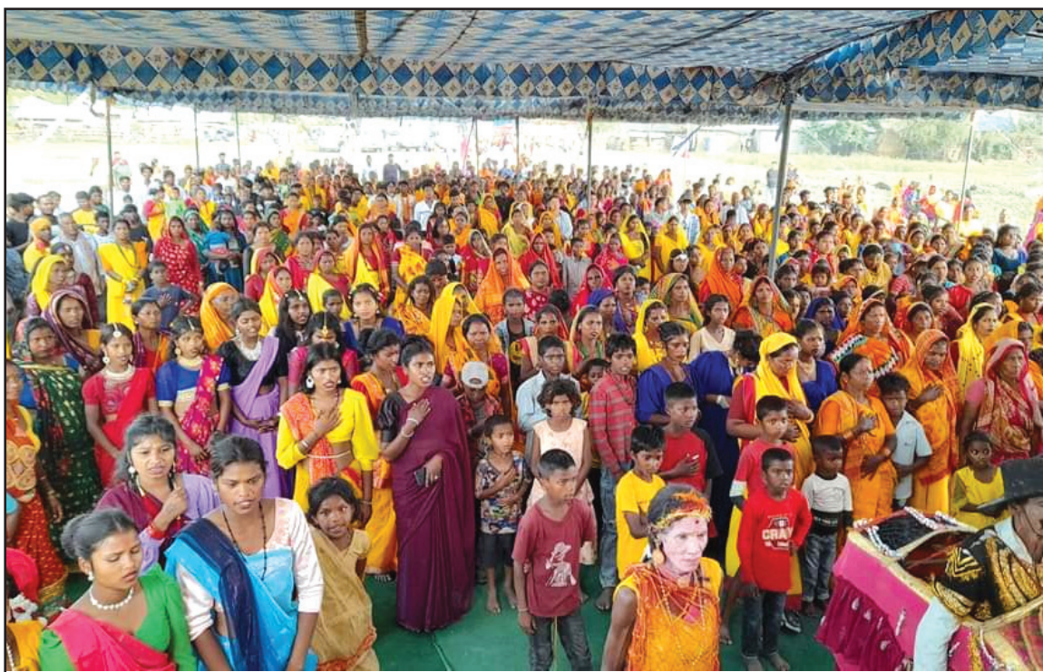
ऐतिहासिक मुसहर सम्मेलनको एक भलक