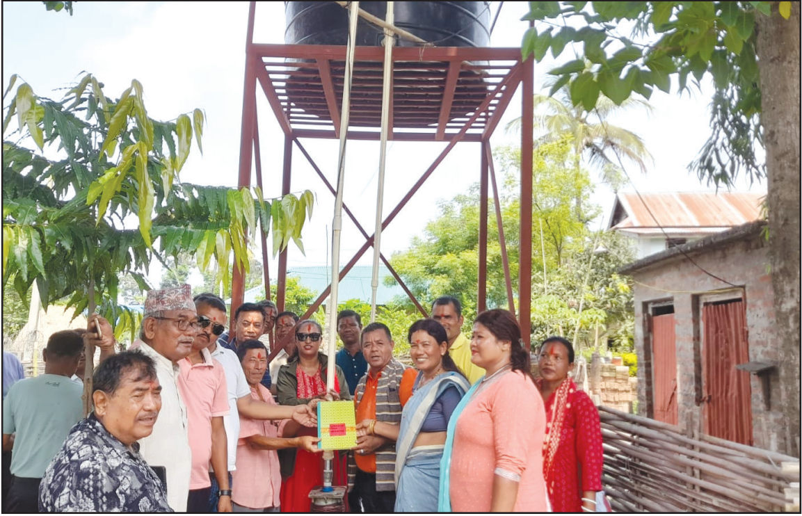
बुढीगंगा गाउँपालिका वडा नं. ७ कमलपुरमा लघु खानेपानी आयोजना उद्घाटन गर्दै गाउँपालिका अध्यक्ष तथा उपाध्यक्ष ज्यू