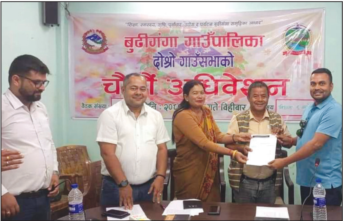
गाउँसभाको चौथो अधिवेशनमा पालिका स्तरीय १० बेड अस्पतालको हस्तान्तरण लिनु हुँदै अध्यक्ष तथा उपाध्यक्ष ज्यू