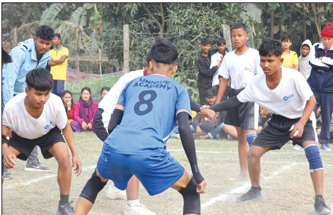
राष्ट्रपति रनिङ्ग शिल्ड कार्यक्रममा आयोजित कबड्डी प्रतियोगिताको भलक