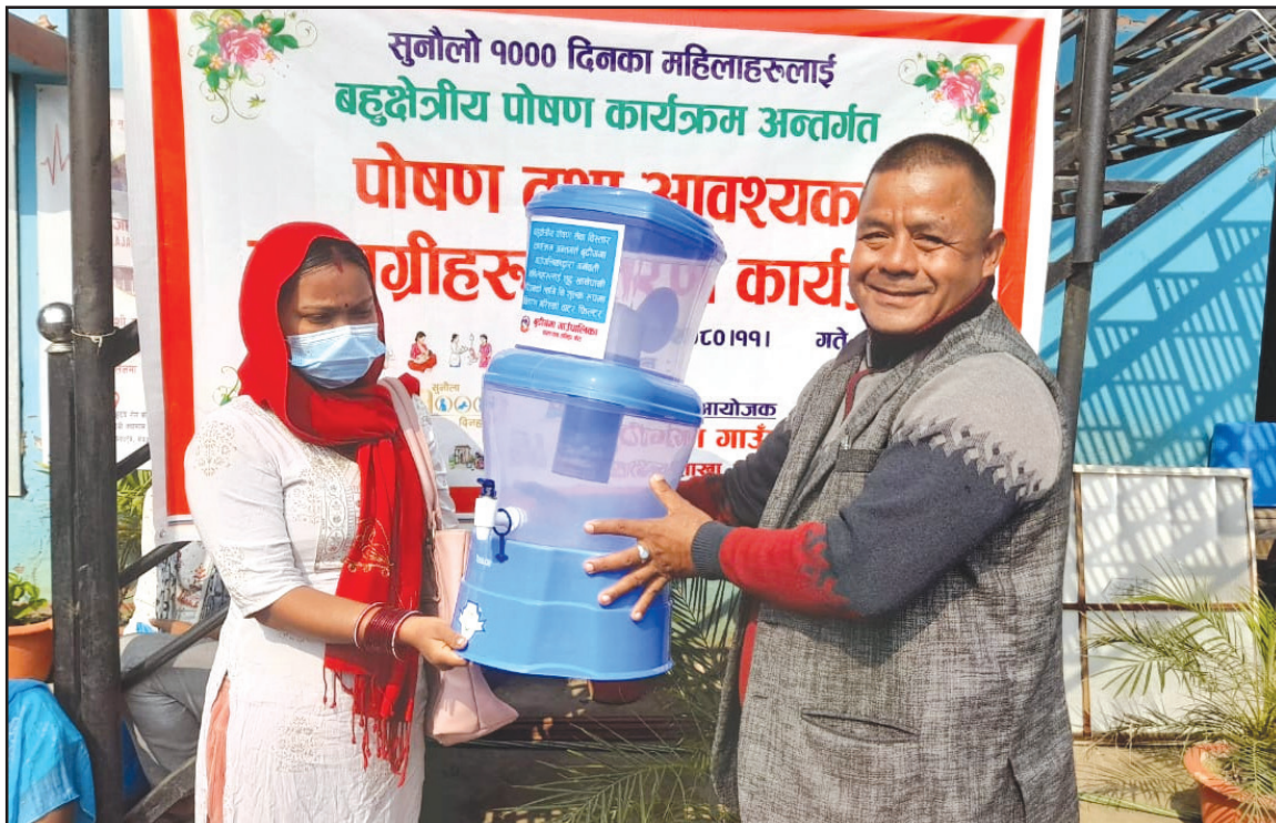
पोषण तथा आवश्यक सामग्री वितरण गर्दै गाउँपालिका अध्यक्ष ज्यू