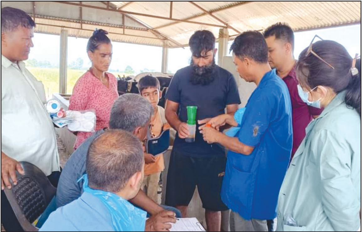
पशु सेवा टेवा कार्यक्रम अर्न्तगत सेवा प्रदान गर्नु हुँदै विज्ञ सहितको टोली