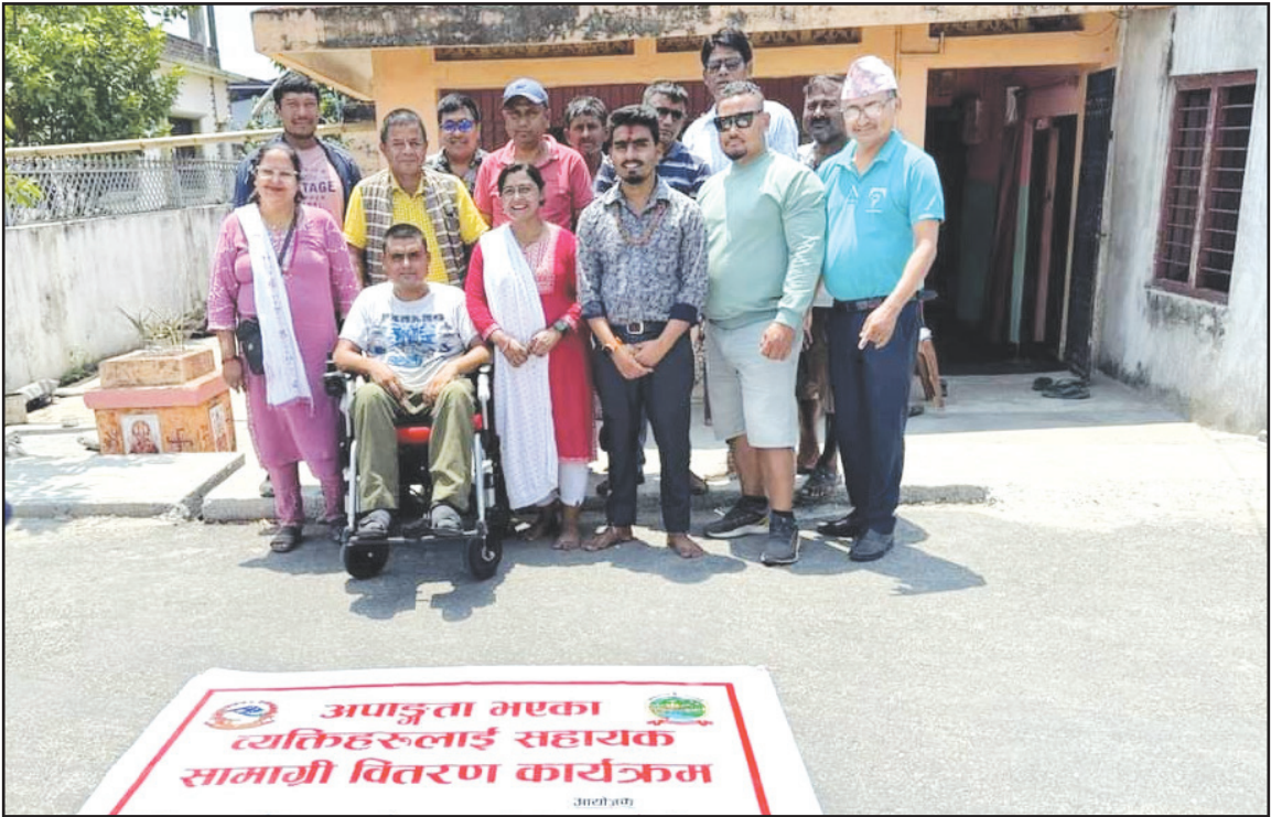
अपाङ्गता भएका व्यक्तिहरूलाई सहायक सामग्री वितरण कार्यक्रमको फलक