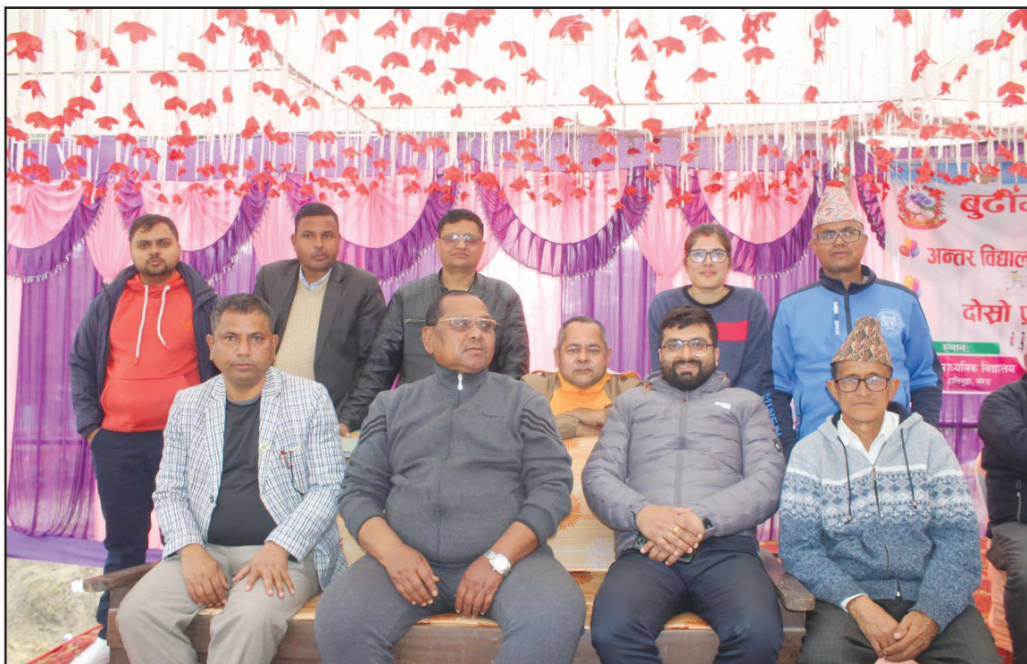
राष्ट्रपति रनिङ्ग शिल्ड प्रतियोगिताको व्यवस्थापन तथा निर्णायक टोली