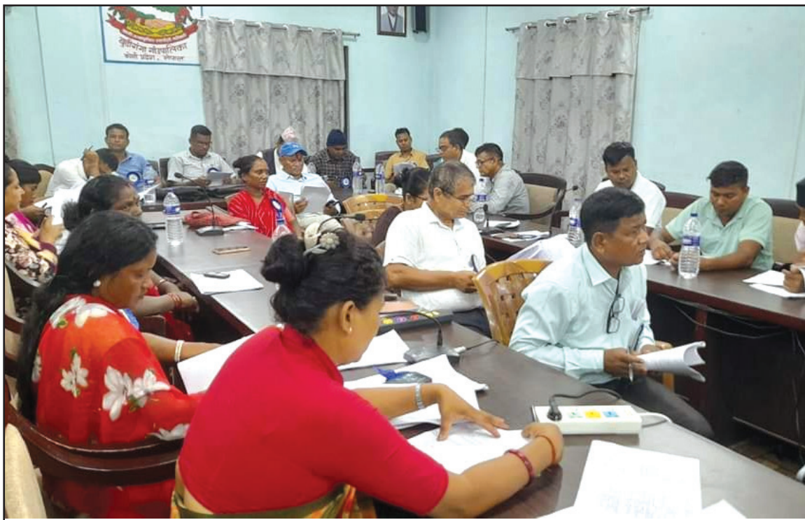
पन्ध्रौँ गाउँसभामा नीति तथा कार्यक्रम अध्ययन गर्नु हुँदै सभासद ज्यूहरु